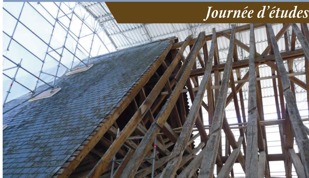
CHARPENTE ET TOITURE DE LA CATHÉDRALE DE BOURGES EN COURS DE RESTAURATION