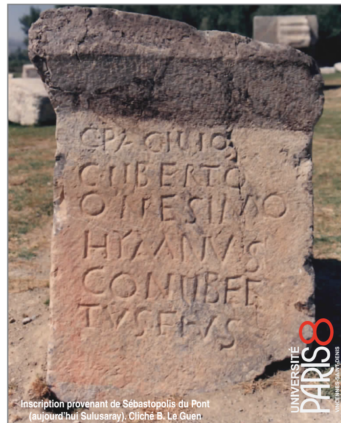
Inscription provenant de Sébastopolis du Pont (aujourd'hui Sulusaray).

UNIVERSITÉ PARIS 8 VINCENTS-SAINTE-DENIS