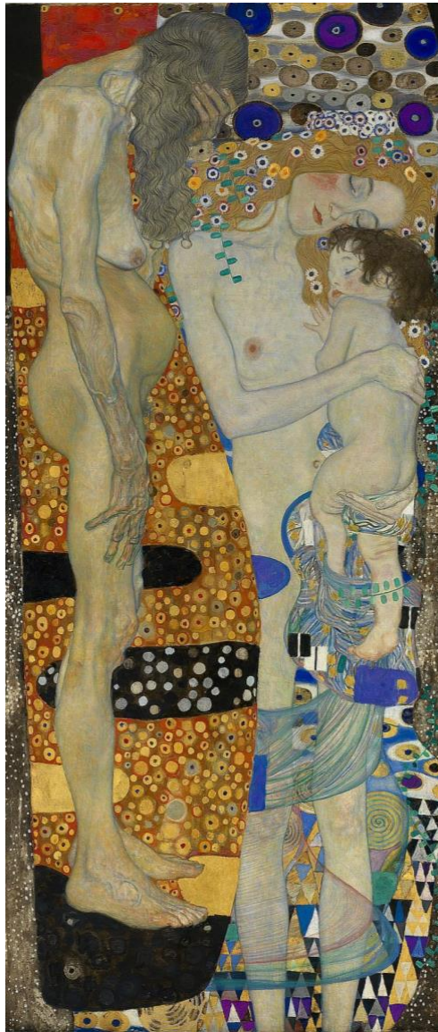
Les trois âges de la femme, 1905, Gustave Klimt