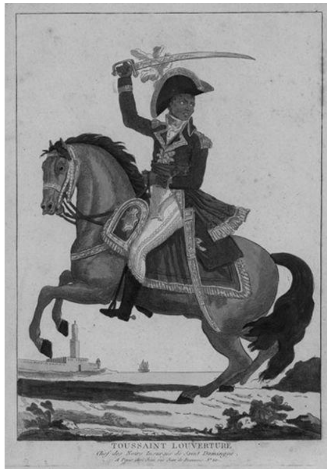
Toussaint Louverture Gravure française de 1802