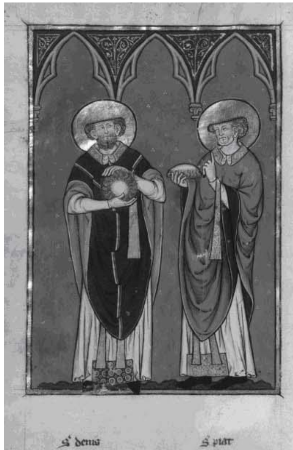
Saint Denis et saint Piat d'après le livre d'images de Madame Marie (Hainaut, vers 1290), BnF, NAF 16251, fol. 84v